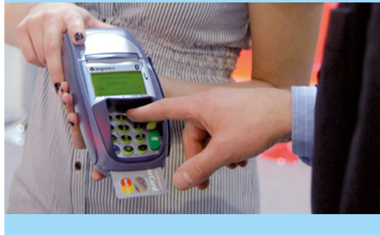
Auf Nummer sicher: Kartenzahlung mit PIN-Eingabe ▼

Begünstigt durch diese flexibel einsetzbaren Sicherheitsmechanismen ist auch der vorläufige Ausfall, der in den Jahren 2004 bis 2006 besorgniserregende Höchstwerte von 0,4 bis 0,5 Prozent des Lastschriftvolumens erreicht hatte, auf einen Wert von 0,19 Prozent zurückgegangen.