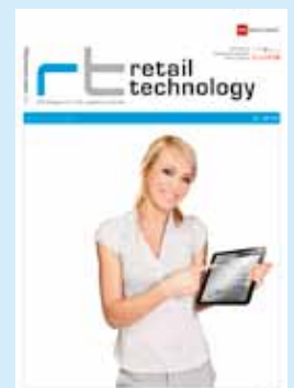
▲ Titelbild: GK Software Foto: © istockphoto.com/kaczka Foto Umhefter: Messe Düsseldorf