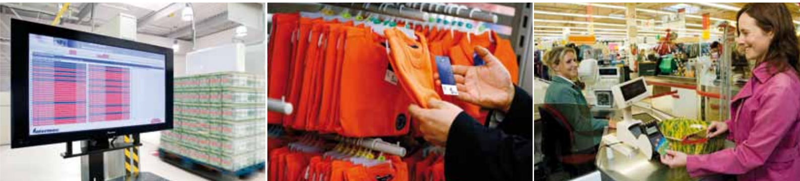
▲ RFID: Metro ist Vorreiter im LEH S. 48