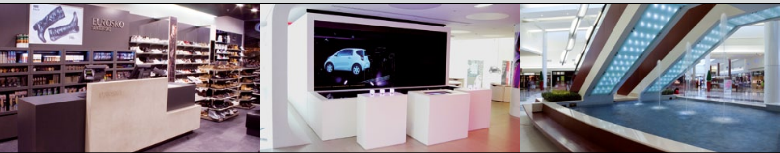
▲ Kassenzone: Der Point of Communication S. 30 ▲ Holografie: Virtuelle Realität am POS S. 72 ▲ Cherry Hill Mall: Licht und Architektur S. 36