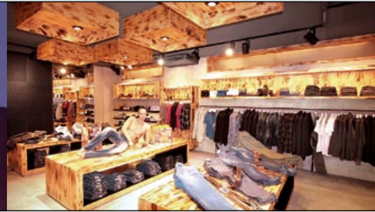
▲ Store des Monats: Style, Sölden S. 26