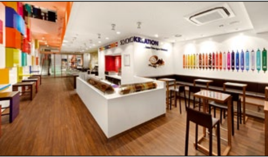
▲ Ritter Sport: Der Flagshipstore S. 24