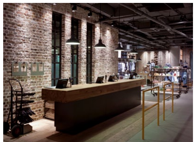
58 Porträt Checkland Kindleysides Schöpfer des neuen Levi's Flagshipstore