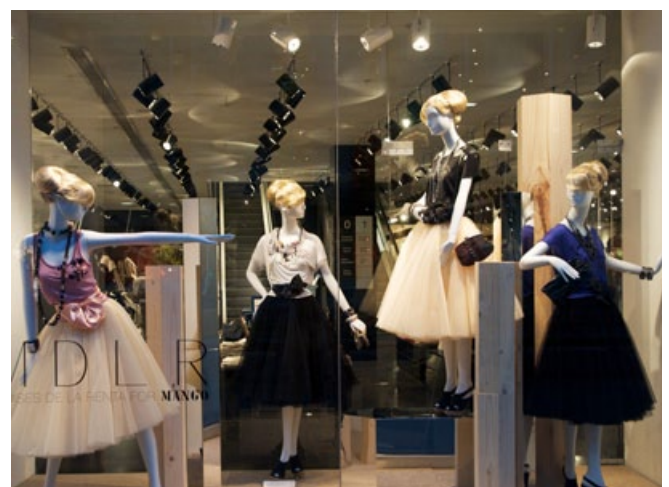
42 stores+shops EXTRA Display Mannequins